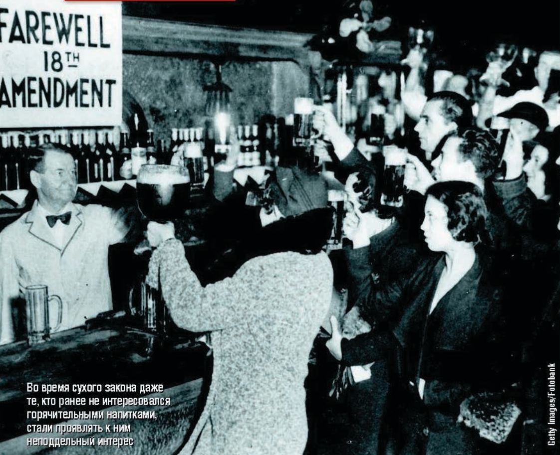
Во время сухого закона даже те, кто ранее не интересовался горячительными напитками, стали проявлять к ним неподдельный интерес