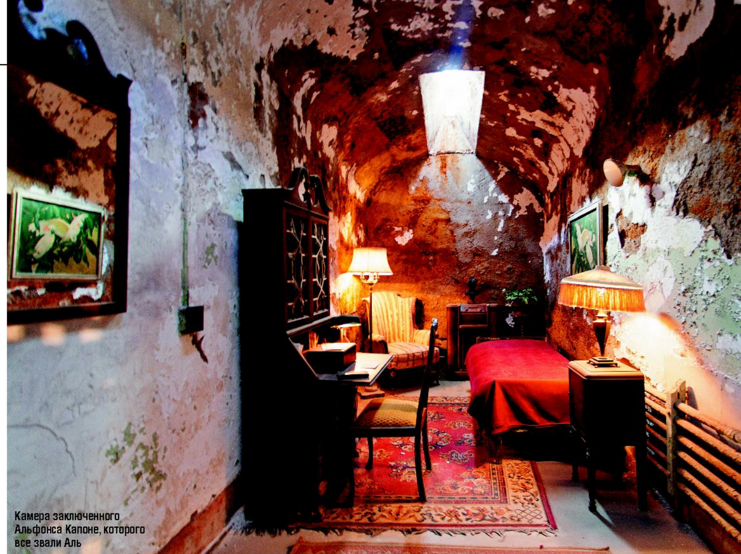
Камера заключенного Альфонса Капоне, которого все звали Аль

Спикизи — (полулегальные притоны, бары или «шепотушки», от англ. «speak easy» — «говорите тихо»). Заказы здесь делали шепотом.