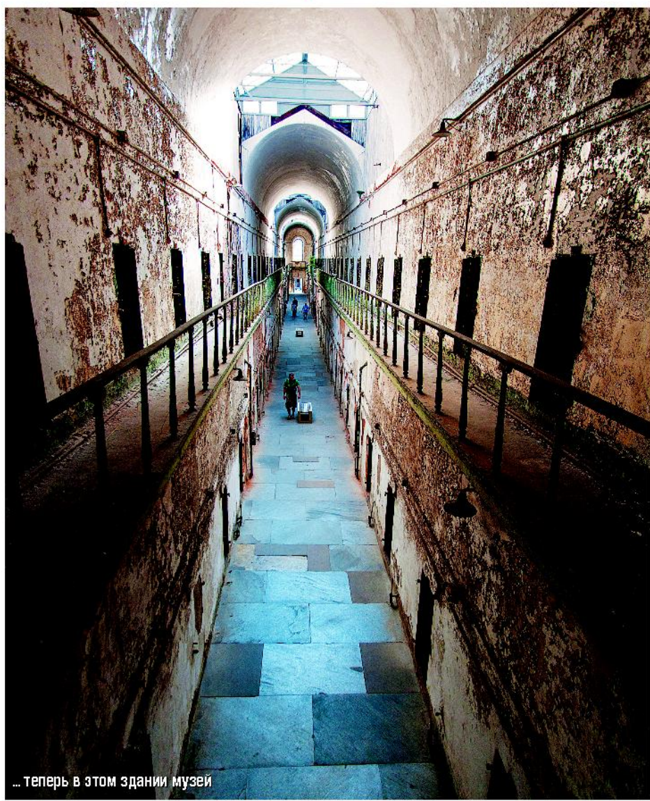
... теперь в этом здании музей

Культовый фильм-мюзикл «Чикаго» Роба Маршалла, удостоенный шести из тринадцати оscarовских статуэток, — настоящий путеводитель по златным местам Америки времен сухого закона. Действие происходит в 20-е годы XX века, когда Америка накануне Великой депрессии переживала непростые времена. Вслед за героями мюзикла корреспонденты «ТН» совершили прогулку в криминальное прошлое Чикаго и Нью-Йорка.