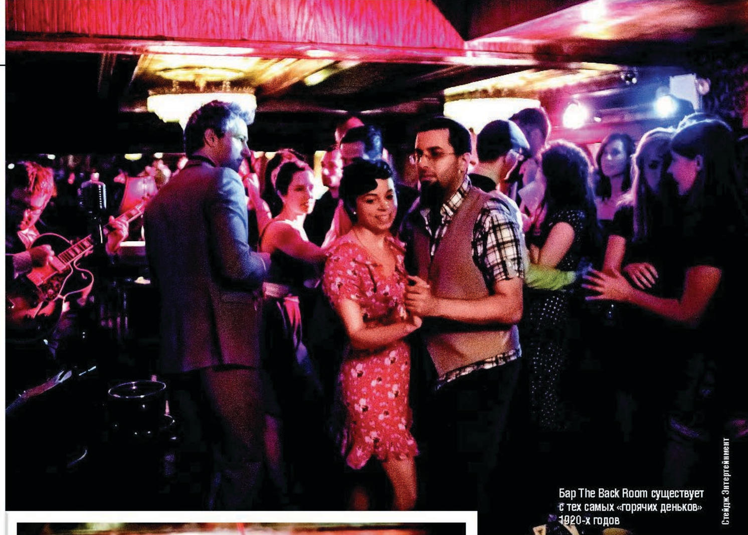
Бар The Back Room существует с тех самых «горячих денюгов» 1920-х годов