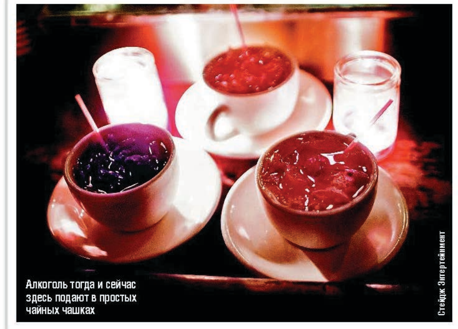
Алкоголь тогда и сейчас здесь подают в простых чайных чашках

«Бойня в День святого Валентина». Терпение президента США Герберта Гувера лопнуло. «Я хочу, чтобы этот парень оказался в тюрьме», — так прозвучал его приказ. 16 июня 1931 года Капоне выслушал обвинение в неуплате налогов и нарушении сухого закона. Это тянуло на 30 лет тюрьмы. Конечно, его люди немедленно подкупили присяжных, и, скорее всего, Капоне удалось бы выйти сухим из воды, если бы не бесстрашный судья. Он совершил беспрецедентный поступок: отправил всех присяжных на слушание в соседний зал, а оттуда взял новых. 24 ноября 1931 года Капоне был приговорен к 11 годам федеральной тюрьмы и штрафу $50 тыс. И возврату в казну $215 тыс. неуплаченных налогов. Капоне отправился в тюрьму, но весь срок не отсидел: его освободили досрочно, так как из-за обострения разных болезней гангстера частично парализовало. В здании тюрьмы города Фи-